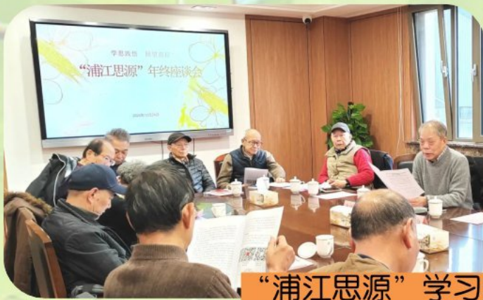
“浦江思源”学习回信精神座谈会