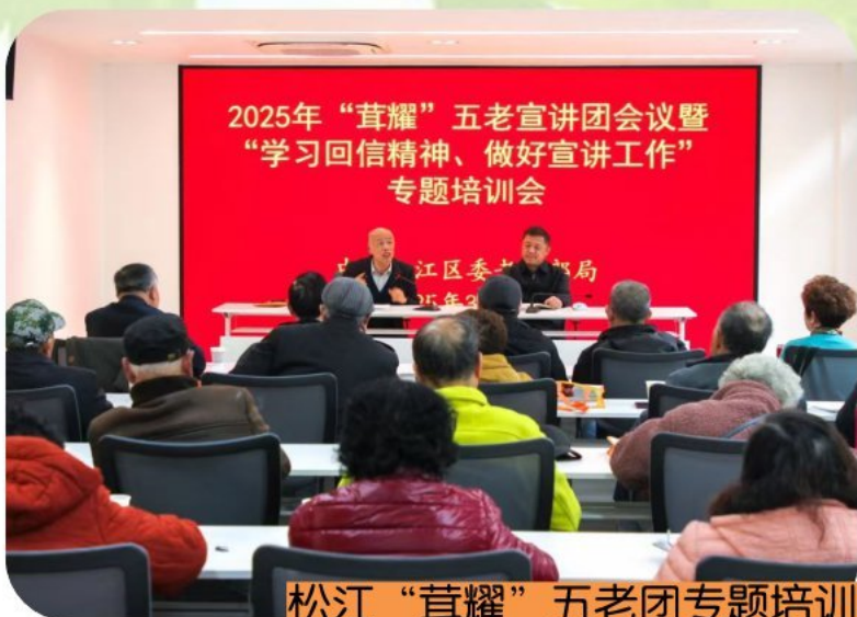
松江“茸耀”五老团专题培训会