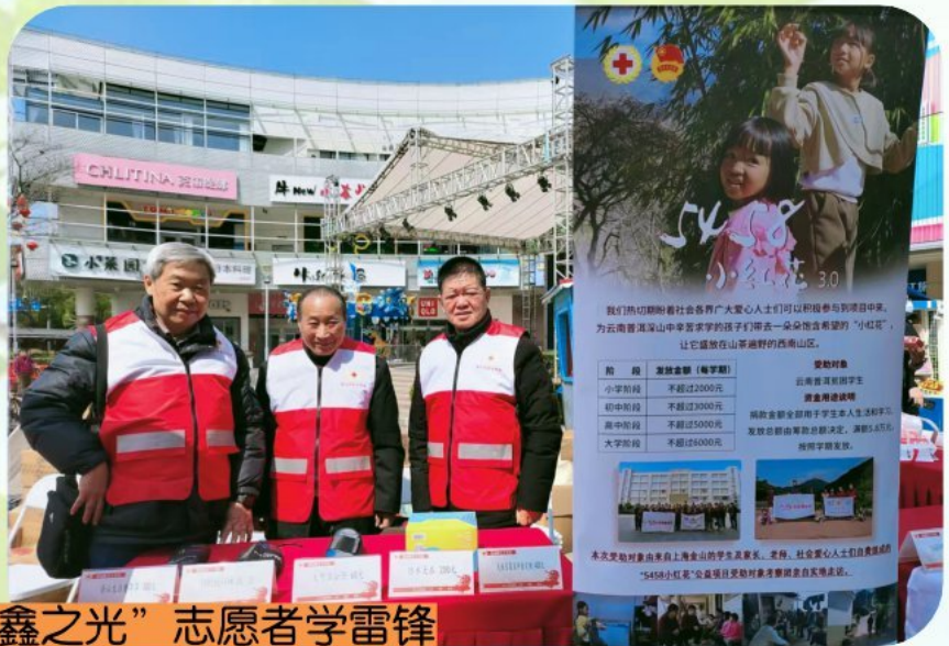
金山“银鑫之光”志愿者学雷锋